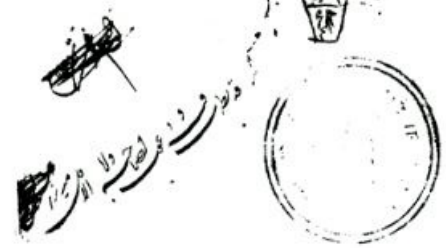
الصيغة الاخيرة من نسخة مكتبة آل كاشف الغطاء